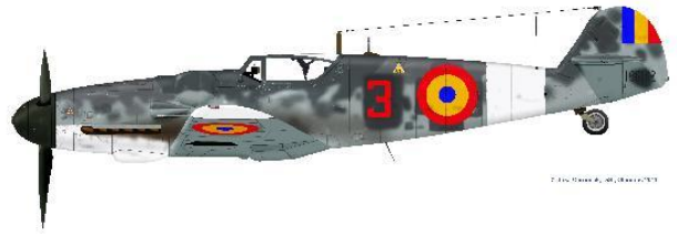
Bokoris Bf-106 G-6 W.nr.166182 přistátého nad Medlovem

Letos uplyne 70 let od události v katastrofu našich obcí, která je v mysli spoluobčanů již zcela zapomenuta, ale v rámci letecké historie jde o zcela ojedinělou akci.