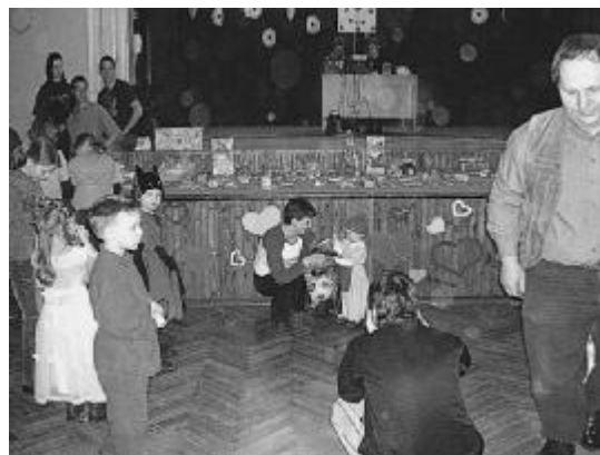
Nádherný karnevalový rej v Sokolovně...