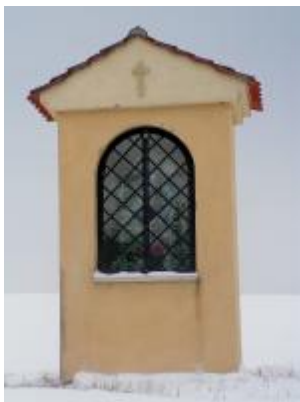
Foto: Kaplička pod Medlovem

Starší kněží někdy radili těm mladším, aby se první rok ve farnosti jen dívali a pozorovali situaci, a až za rok se pustili do změn. Přiznám se, že jsem tuhle radu příliš nedodržel, a tak i ten první rok ve farnosti stojí za ohlédnutí.