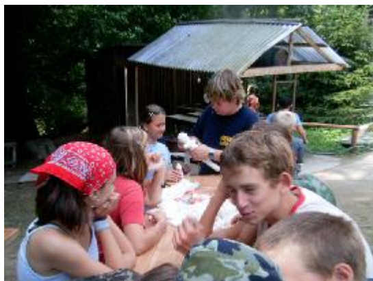
Foto: Na táboře vládne vždycky pohoda