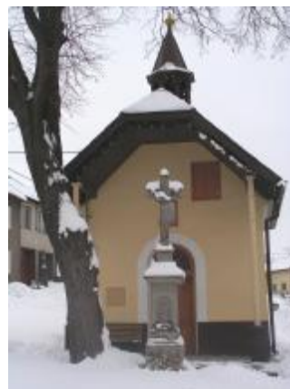
Foto: Kaple v Medlově

Pevně věřím, že nová farní rada přispěje k lepší spolupráci mezi věřícími a farářem a také se zapojí do života farnosti s novým elánem a iniciativou. Aktivní zapojení do života církve a farnosti se očekává ale i od každého jednotlivého věřícího. Ani farní rada by nemohla dobře pracovat bez podpory ostatních farníků.