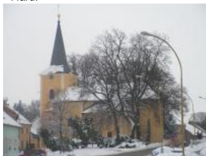
Foto: Kostel ve Zborovicích

Každou z těchto farností jsem přebral ve velmi špatném stavu. Ve Zborovicích byla ve velmi špatném stavu fara a její rekonstrukce si vyžádá velké finanční náklady. V Hošticích je fara přímo v dezolátním stavu a v kostele byla špatná elektroinstalace a v Litenčicích mám v havarijním stavu střechu kostela i faru.